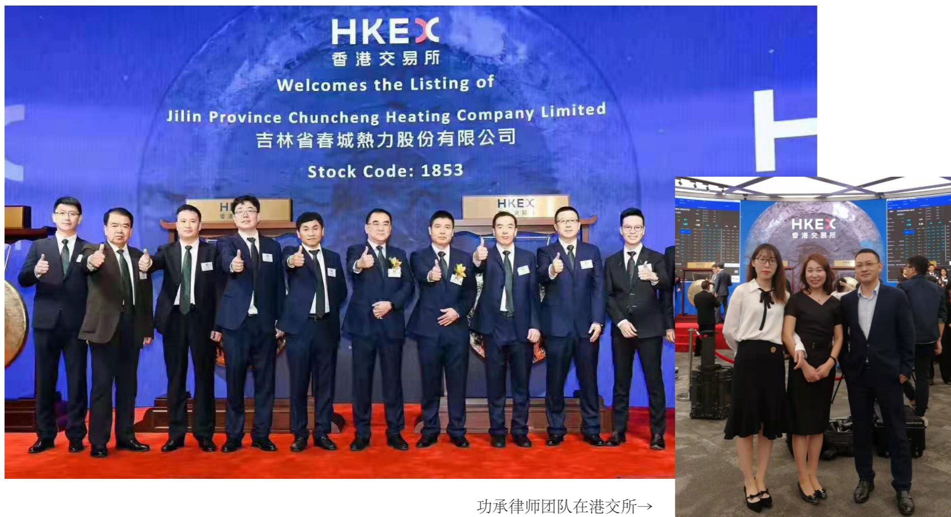
功承律师团队在港交所→

2019年10月24日，春城热力（股票代码：01853.HK）在香港联合交易所有限公司主板成功挂牌上市，功承在本项目中担任保荐人及承销商中国法律顾问。